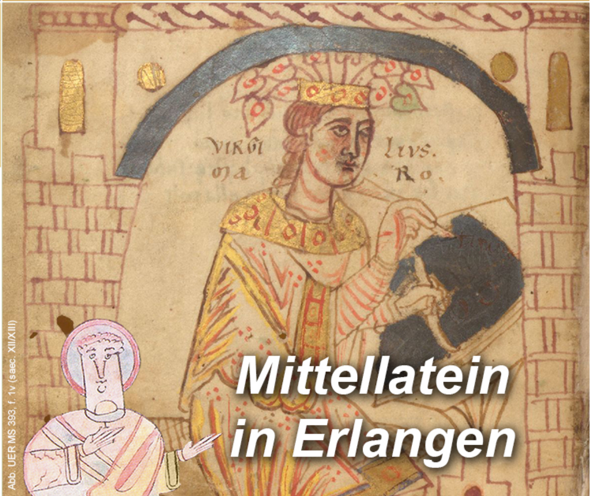
Abb. UER MS 393, f. 1v (saec. XII/XIII)

Mittellatein und Neulatein, mit den Angeboten für die Studiengänge Antike Sprachen & Kulturen, Germanistik, Geschichte, Lateinische Philologie | Latein, Literaturstudien sowie Mittelalter und Frühe Neuzeit